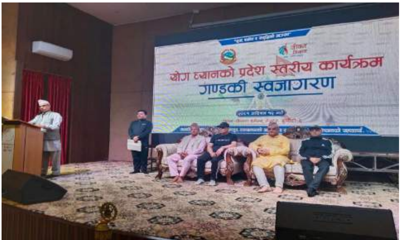
योग ध्यानको प्रदेशस्तरीय कार्यक्रममा मा.मुख्यमन्त्रीज्यू लगायत विशिष्ट व्यक्तित्वहरु