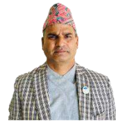
फणीन्द्र देवकोटा माननीय मन्त्री ऊर्जा, जलस्रोत तथा खानेपानी मन्त्रालय