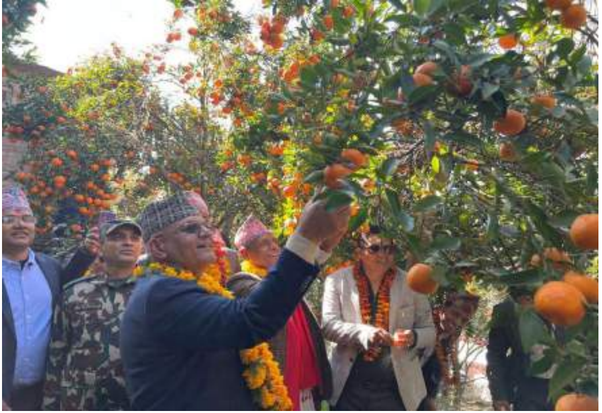
बासखर्क सुन्तला बगैचा निरीक्षण गर्नुहुँदै माननीय मुख्यमन्त्री