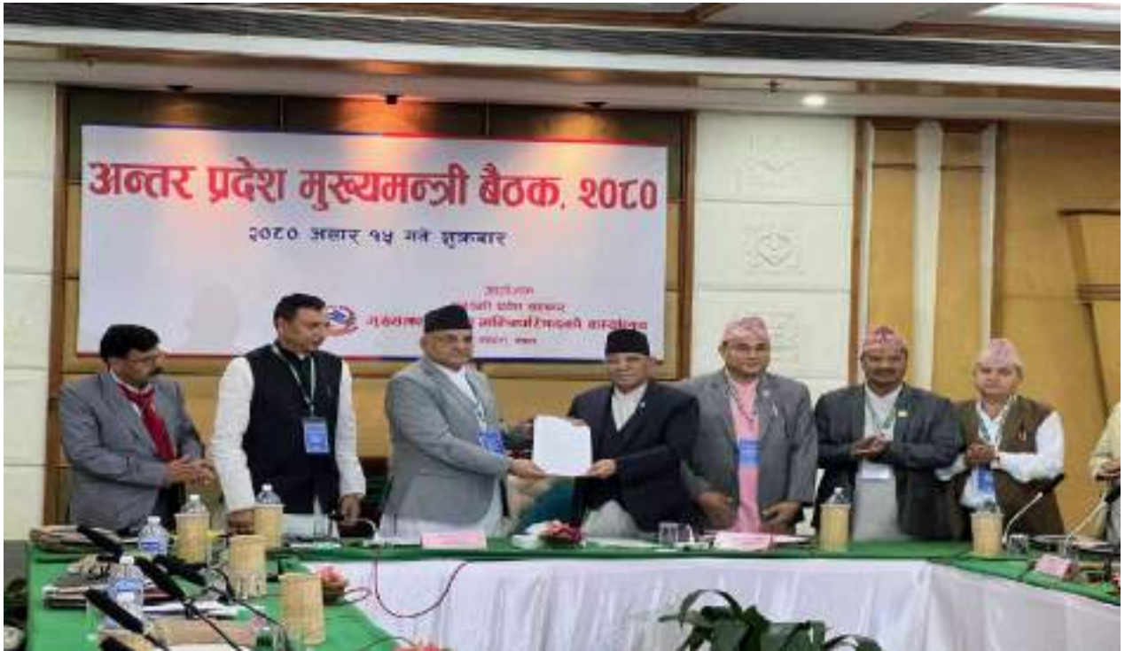
पहिलो अन्तरप्रदेश मुख्यमन्त्री बैठक, २०८०