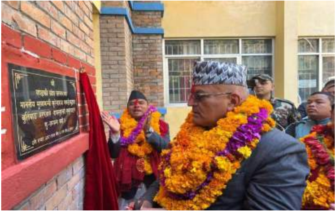
बुर्तिवाड अस्पताल, बागलुङको समुद्घाटन गर्नुहुदै माननीय मुख्यमन्त्री