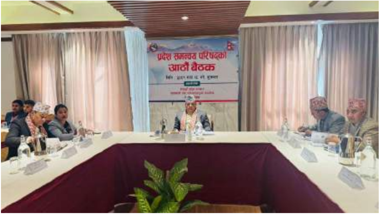
प्रदेश समन्वय परिषदको बैठक