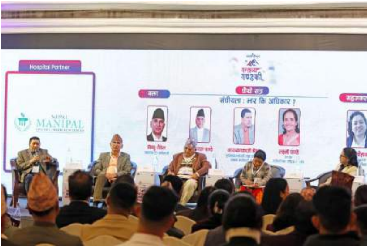
गन्तव्य गण्डकी कार्यक्रममा माननीय मुख्यमन्त्री