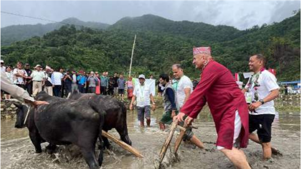
रोपाई महोत्सवमा सहभागी हुँनुहुँदै माननीय मुख्यमन्त्रीज्यू